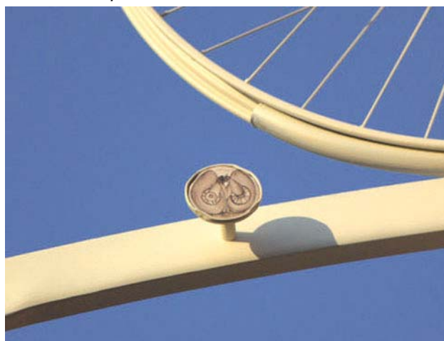
Particolare della medaglia in ceramica dedicata al ciclista faentino Aldo Ronconi