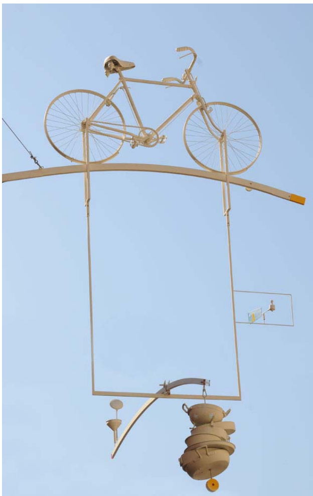
Immagine dell'opera sospesa in ferro verniciato