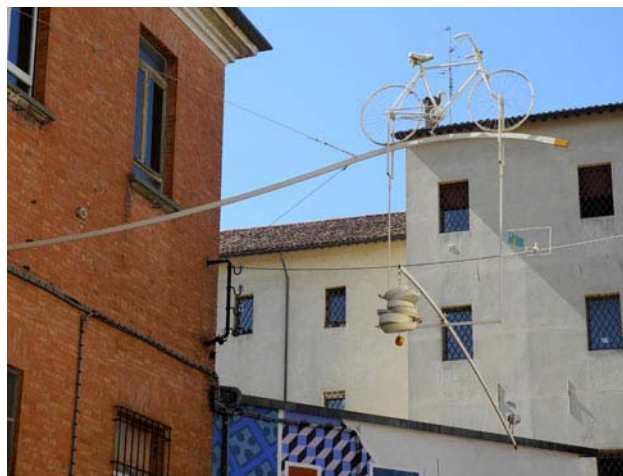
L'opera installata in via Seminario