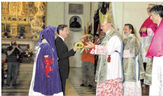
Cerimonia dei Ceri 2009: scambio dei doni tra il sindaco e il vescovo di Faenza.

Forse che in zona non potesse esserci qualcuno? Ah dimenticavo, meglio non disturbare troppo il manovratore!! La chirurgia esegue interventi minimi e le sale operatorie sono sottoutilizzate. La gente va altrove quando si presentano patologie complicate, vedi Forlì, Cesena, Bologna, Imola.