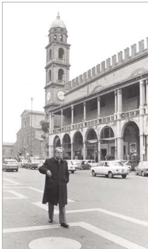
1975: Franco Gentilini a passeggio in piazza del Popolo.