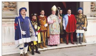
Nibalzo 2009: il vescovo di Faenza all'ingresso della cattedrale.

Partendo dal tema della valorizzazione delle competenze del territorio, è chiaro che essa passa essenzialmente attraverso la selezione delle risorse umane e la creazione di un management di alto livello. A questo riguardo occorre notare come, a tutt'oggi, entrambe le strutture siano prive di una direzione e come l'Amministrazione Comunale anziché investire su giovani talenti faentini (che non mancano), stia arrembiando per un tacito affidamento di funzioni e competenze direzionali a strutture con sede a Cesena. Sulla sostenibilità economica dei progetti poi i dubbi sono ancora più rilevanti. Basti pensare che l'Agenzia Polo Ceramico, a metà degli anni '90, con l'operazione di incubazione del R.I.T. aveva prodotto un deficit di poco inferiore al miliardo delle vecchie lire e che pochi giorni fa, il Comune ha ripianato perdite pregresse della società Terre Naldi per poco meno di 250.000 euro. Se il Piano di risanamento del Polo di Tebano passa attraverso una separazione dei percorsi di gestione dei terreni agricoli da quello dell'Università e Ricerca (cosa di per sé condivisibile), e se è vero che ciò sarà attuato mediante il sub-affitto dei terreni ed il passaggio del personale da Terre Naldi al CRPV, come è possibile che tale operazione venga gestita (come pare), con il necessario