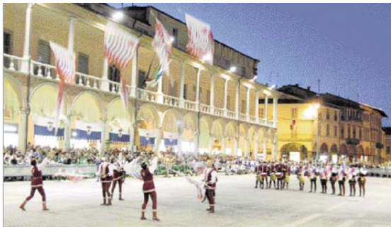
Un'esibizione della piccola squadra del Rione Rosso.