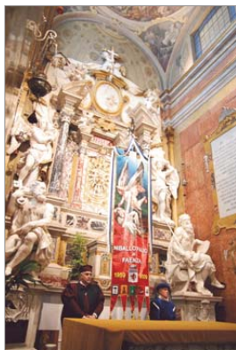
L'altare maggiore della cattedrale all'inizio della Cerimonia dei Ceri 2009.

Faenza ancora troppi marciapiedi impraticabili per una carrozzella perché troppo stretti, molti edifici pubblici e privati, inaccessibili, parchi pubblici senza vie di accesso ed un servizio di trasporto pubblico carente in tema di mobilità. Compito prioritario dell'amministrazione comunale sarebbe differenziare progettualità e sostegni, con l'obiettivo principale di migliorare la qualità di vita di tutti i disabili, tanto da poter favorire, ogniqualvolta possibile, la vita indipendente, garantendo la piena integrazione e partecipazione alla vita della comunità delle persone diversamente abili; un grande passo in avanti sul piano culturale e su quello del raggiungimento di un superiore grado di civiltà per il rispetto della dignità, dei diritti, delle pari opportunità. Va valutata un'attenta presa in esame delle esigenze dei disabili residenti nel comune che dovranno essere messi nelle condizioni di esprimere al meglio le proprie opportunità. Va inoltre attivata una campagna di sensibilizzazione, che