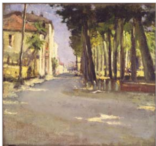
1931: Viale Tondo (olio su tela).

Una testimonianza di quel corredo, ma anche una prova delle grandi capacità artistiche di Gentilini è stata raccolta in una mostra promossa dalla Pinacoteca e dalla Banca di Romagna,