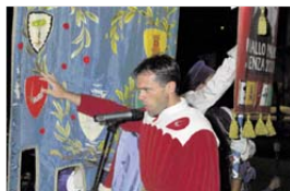
Il giuramento del cavaliere del Rione Rosso.

mi sulla scarsità esistente nella comunicazione. A mio avviso il Palio del Niballo è poco pubblicizzato: servirebbe ricercare un modo per poter incentivare ciò non solo tramite la stampa locale, ma quella regionale e nazionale, la televisione pubblica e privata, affinché questa manifestazione venga ulteriormente valorizzata e potenziata, inserendola anche nella promozione turistica della città, per promuovere appunto il Palio e la città stessa. Esiste una realtà degna di nota: il centro civico dei Rioni, struttura unica nel suo genere a livello nazionale che molti ci invidiano. Inserito in una zona di grande valore paesaggistico, esso è sede di incontri sociali e culturali fra giovani ed anziani. Presso questo centro trovano sede le scuderie rionali e spazi attrezzati per l'allenamento dei cavalli e cavalieri. Anche in questa sede molto ci sarebbe da fare per un migliore utilizzo della stessa. I Rioni con il Gruppo municipale e l'Amministrazione dovrebbero rivedere il regolamento e apportare le dovute modifiche, affinché ci sia più apertura ad iniziative diverse, a manifestazioni ulteriori, anche per sopprimere ai tempi morti che la struttura ha, auspicando nuovi spazi a disposizione di tutti. Sono stato informato che nel periodo invernale la struttura non è stata usata a causa delle troppe precipitazioni (non so come facciano negli ippodromi e nei centri dove si usano le strutture tut-