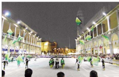
Gara delle Bandiere 2008: l'esibizione della grande squadra del Rione Verde.