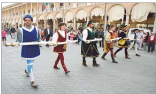
Niballo 2009: l'arrivo dei Ceri.