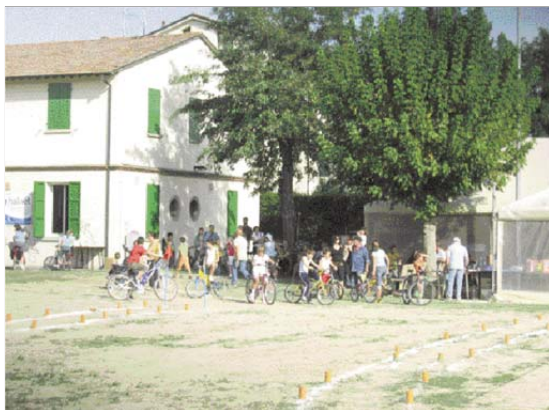
Una gimkana per ragazzi al parco Mita.

L'attivazione di un organismo alternativo alle Circoscrizioni significa per-