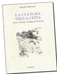
Alessandro Montecvecchi La cultura nella città Edit, Faenza, dicembre 2006, pp. 171, € 15,00

L'autore, raccogliendo in un unico volume alcuni saggi sulla storia culturale di Faenza e della Romagna nel XX secolo ha voluto, tra l'altro, «offrire un contributo ad una lettura della realtà culturale romagnola che vada oltre gli stereotipi più facili (e trionfanti per l'identificazione con la dittatura)... che incontrano una resistenza prudente ma abbastanza tenace da parte di gruppi di intellettuali, anche modesti e spesso di idee conservatrici, che però si impegnarono allo scopo di preservare una immagine più ricca e meno banale della Romagna, e nel contempo di difendere una certa autonomia e dignità del loro lavoro dai condizionamenti della dittatura».