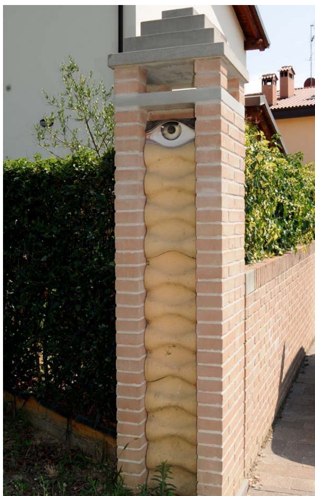
Immagine di uno dei pilastrini in ceramica