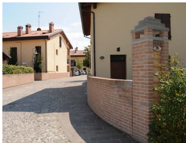
Strada di accesso al quartiere S.Lucia