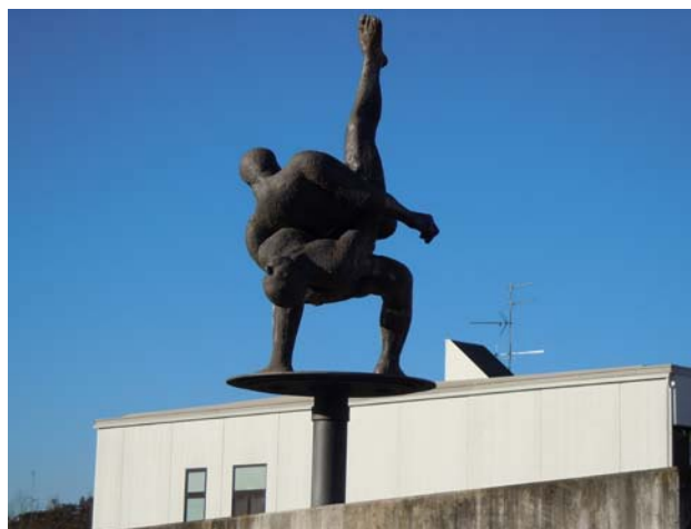
Vista dell'opera collocata nel piazzale Golinelli