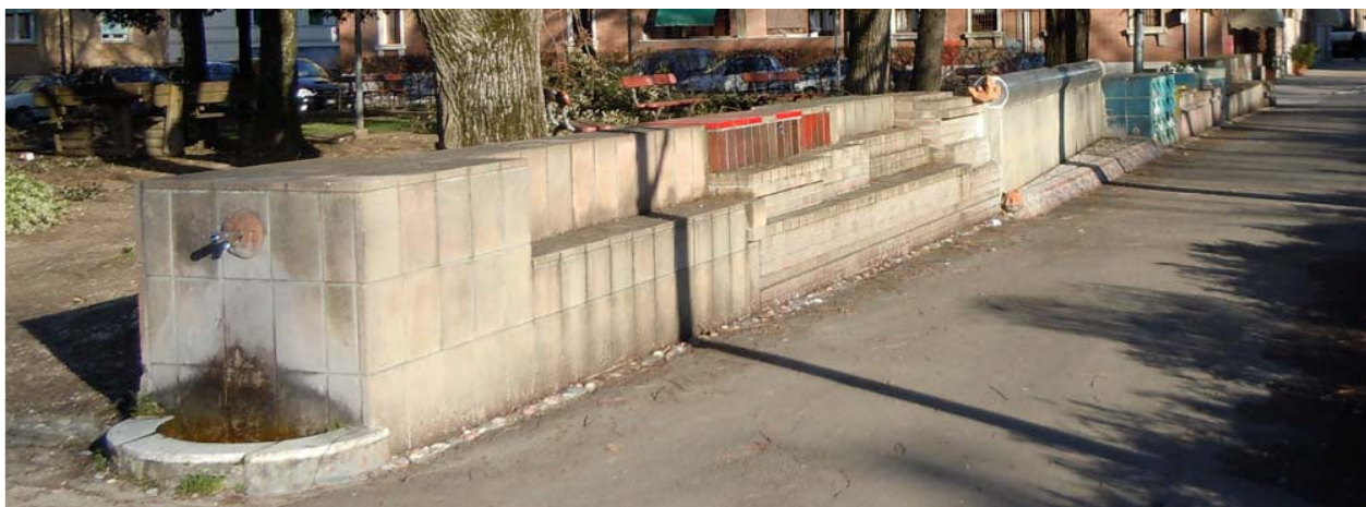
Veduta dell'opera da corso Europa, angolo via Argine Lamone, in evidenza il mattone industriale porpora in argilla refrattaria