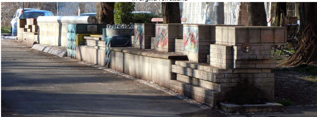
Veduta dell'opera da corso Europa, angolo via Torretta