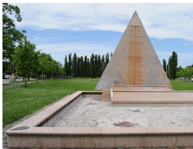
Retro prospetto della fontana