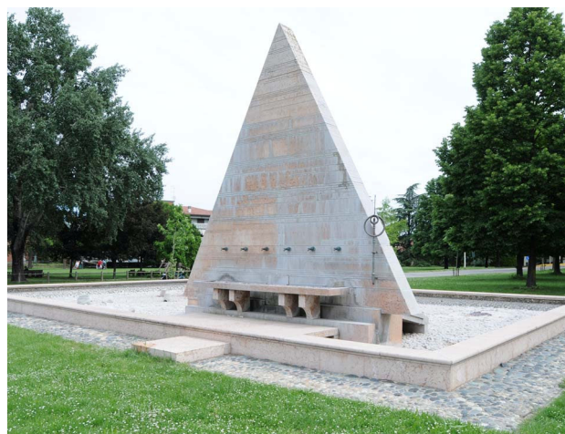
Vista frontale della fontana