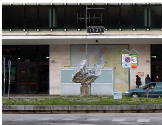
Vista da viale Baccarini