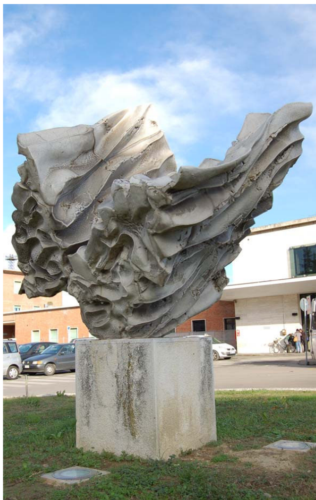
Celebrazione degli eserciti che contribuirono alla liberazione di Faenza (II guerra mondiale)