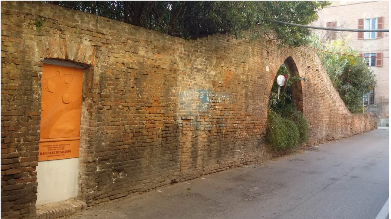
Vista dell'opera da Via Santa Maria dell'Angelo