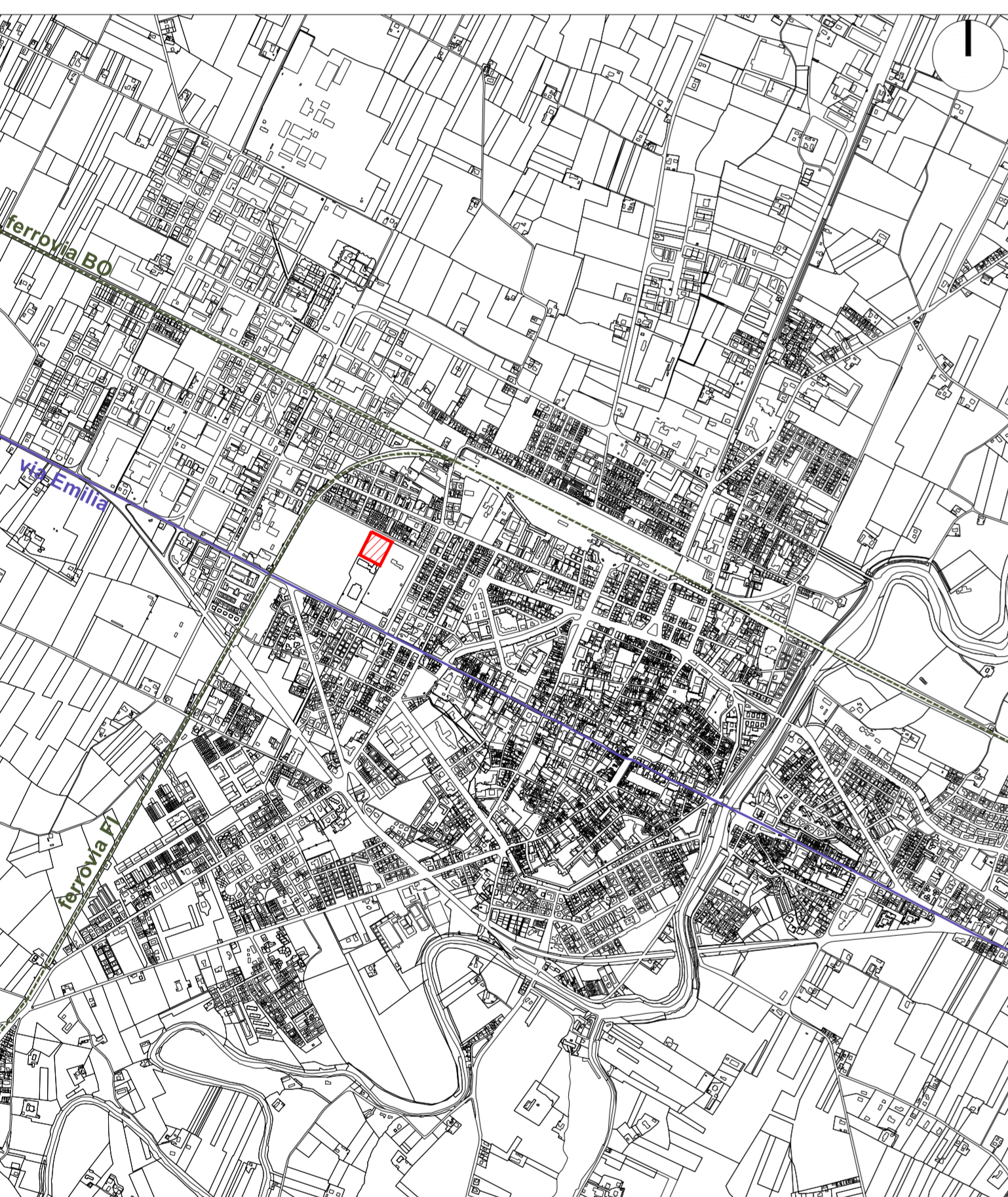
PLANIMETRIA scala 1:5.000