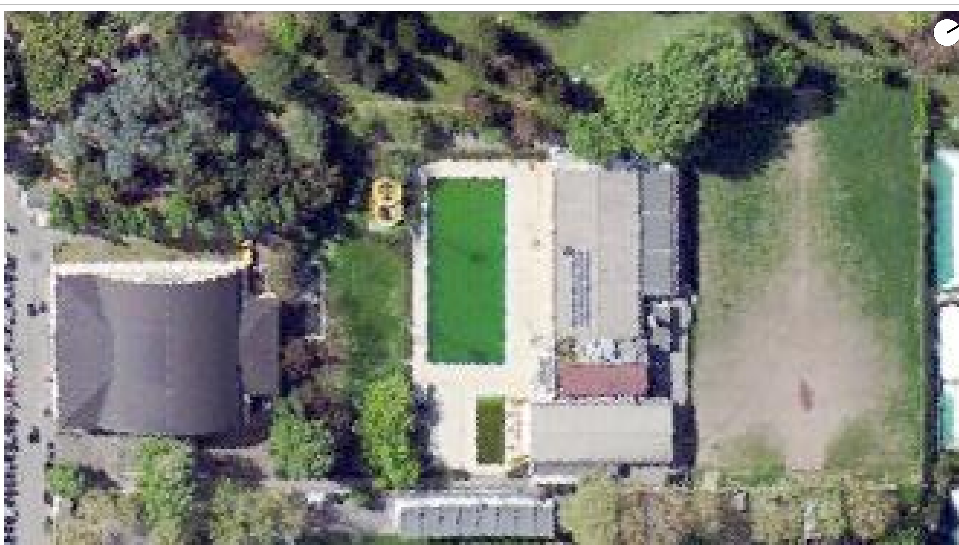
ORTOFOTO STATO DI FATTO scala 1:500

TUTTI I DIRITTI SONO RISERVATI, OGNI RIPRODUZIONE ANCHE PARZIALE DEL SEGUENTE DISEGNO E' PERSEGUIBILE AI TERMINI DI LEGGE - (art. c.c. 2576)