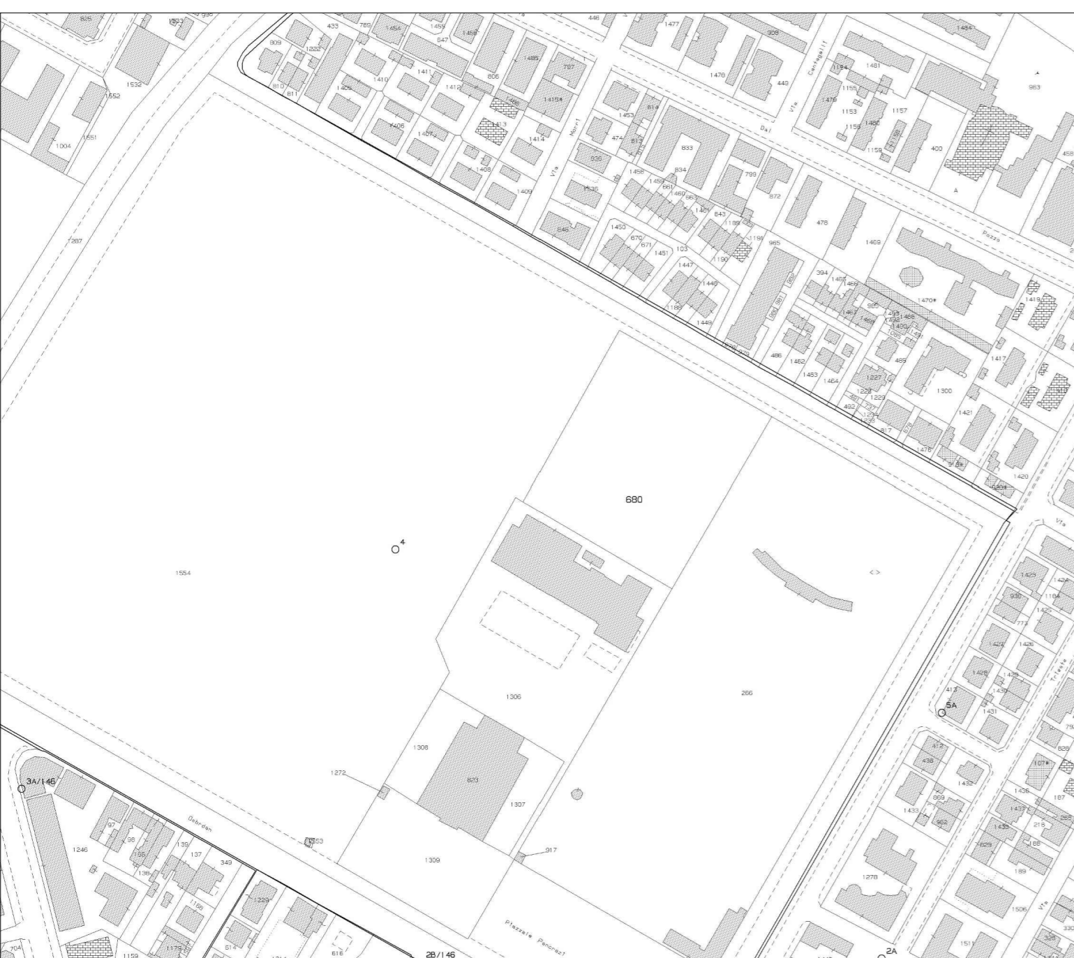
ESTRATTO DI MAPPA scala 1:2.000