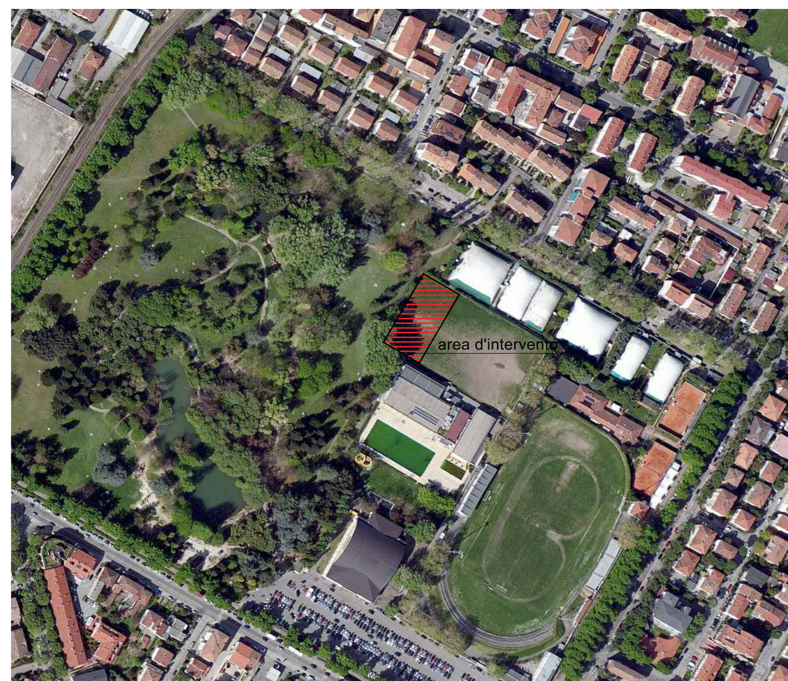
ORTOFOTO scala 1:2.000