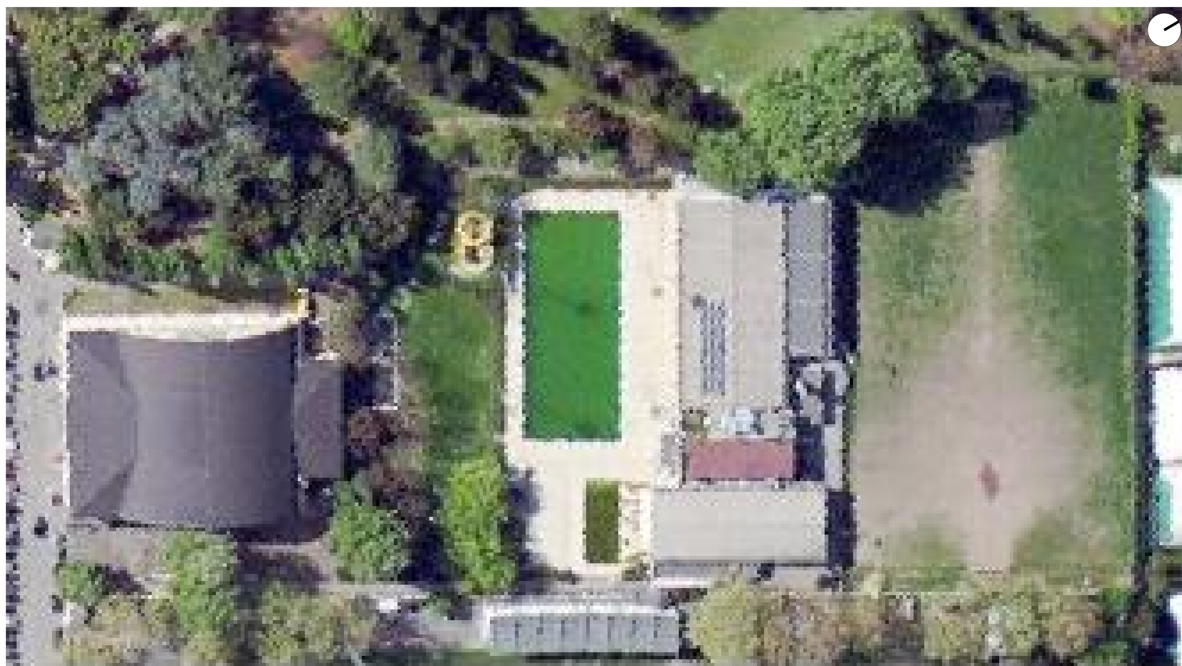
ORTOFOTO STATO DI FATTO scala 1:500

TUTTI I DIRITTI SONO RISERVATI, OGNI RIPRODUZIONE ANCHE PARZIALE DEL SEGUENTE DISEGNO E' PERSEGUIBILE AI TERMINI DI LEGGE - (art. c.c. 2576)