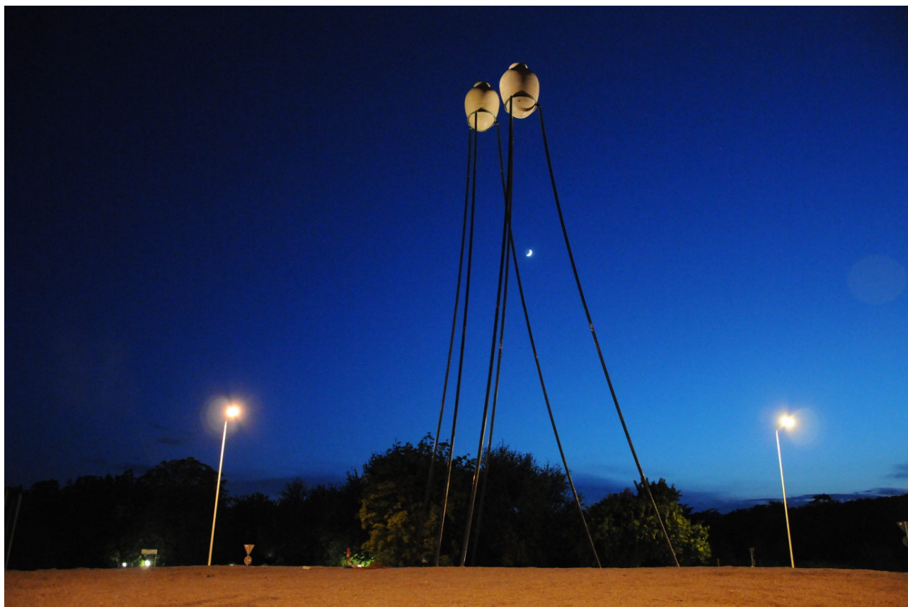
Vista notturna dell'opera