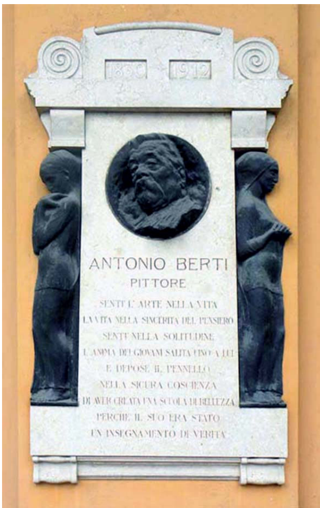
Immagine della tomba con gli inserti bronzei