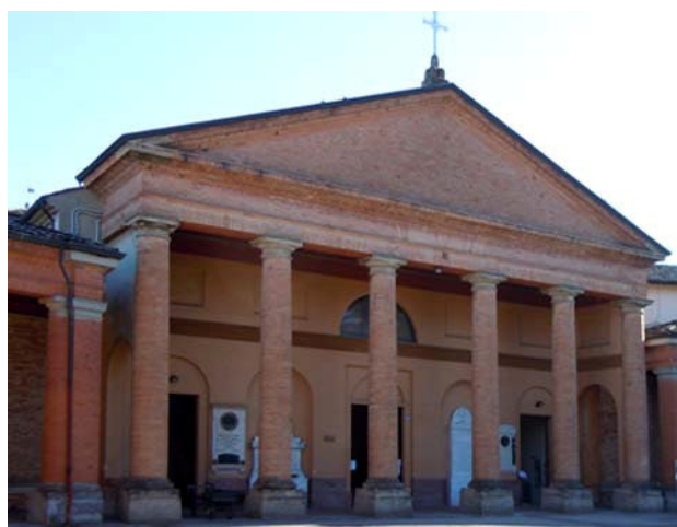
Ingresso del cimitero dove è collocata l'opera